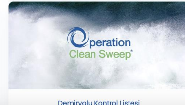
Demirvolu Kontrol Listesi