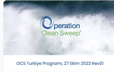
OCS Türkiye Programı, 27 Ekim 2023 Rev01