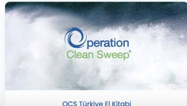
OCS Türkiye El Kitabı