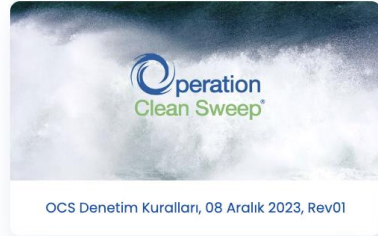
OCS Denetim Kuralları, 08 Aralık 2023, Rev01